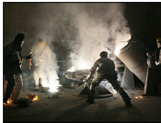
परमाणु संयंत्र में होने वाली किसी भी दुर्घटना के लिए कंपनी के साथ आपूर्तिकर्ता की जवाबदेही तय करने का दबाव है

मंगलवार को वामपंथी नेता सीताराम येचुरी से हुई चर्चा के बाद प्रधानमंत्री कार्यालय में राज्यमंत्री के रूप में कार्य कर रहे पृथ्वीराज चौहान ने कहा है कि विपक्ष ने जिन हिस्सों पर आपत्ति की है उसे सरकार हटाने को तैयार है.